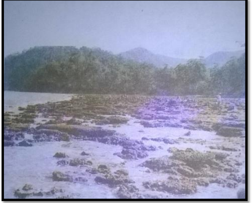
चित्रम् -7.4 प्रवाल-द्वीपः

प्रवालः इति लघुसामुद्रिकजन्तूनां अस्थिपञ्जराः सन्ति यः पॉलिप इति उच्यते। यदा जीवितपॉलिपाः म्रियन्ते तदा तेषाम् अस्थिपिञ्जरः अवशिष्यते। अन्यपॉलिपानां वृद्धिः एतेषां दृढीभूतानाम् अस्थिपिञ्जराणाम् उपरि भवति ये वृद्धिम् उपगच्छन् महोन्नताः जायन्ते तथा च अनेन प्रकारेण प्रवालाः इति द्वीपानां निर्माणं कुर्वन्ति । 7.4 इति चित्रे प्रवालः इति द्वीपान् दर्शयति ।