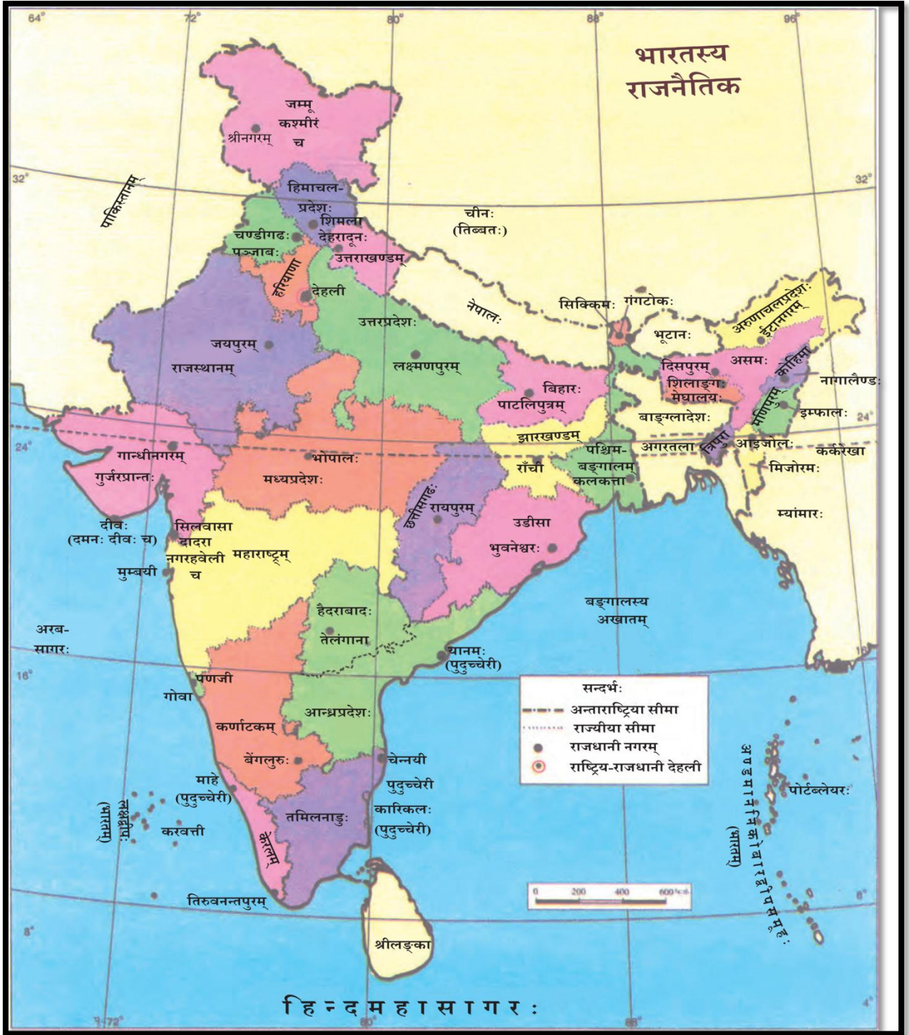
चित्रम् – 7.2 भारतस्य राजनैतिकं मानचित्रम्

* जूनमासे 2014 तमे वर्षे तेलङ्गाना भारतस्य एकोनत्रिंशं/ नवविंशं राज्यं जातम् एतेषु के के देशाः सन्ति येषां सीमाः समुद्रेण युक्ताः न सन्ति ? दक्षिणे समुद्रे स्थितौ द्वौ श्रीलङ्का-तमालदीवद्वीपौ अस्माकं प्रतिवेशिनौ स्तः । पाकजलसन्धिः भारतं श्रीलङ्कातः पृथक् करोति ।